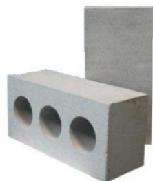
Кирпич стеновой бетонный устотный 250x120x88