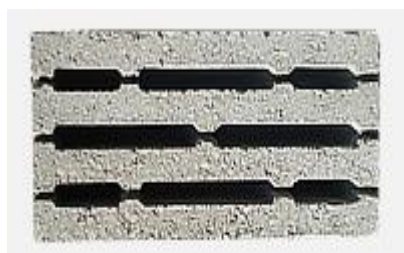
Блок стеновой 8-ми щелевой 390x190x188