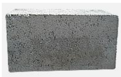
Блок стеновой полнотелый 400x200x200